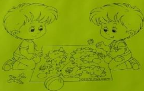
Игра «Шаг к успеху»